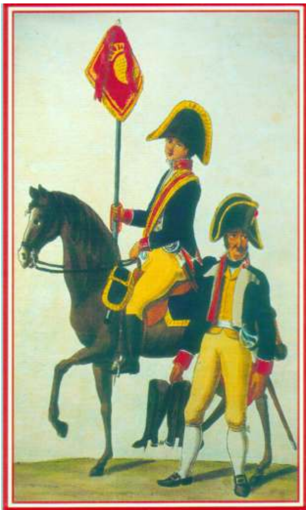
Abb. 2: Standartenjunker und Reiter des Regiments "Infante" zwischen 1806 und 1815 10

Im Herbst 1807 lagen 50 Mann spanische Kavallerie in Farmsen, im Winter waren dort 60 Mann und 9 Offiziere des Dragonerregiments "Infante" stationiert. 9