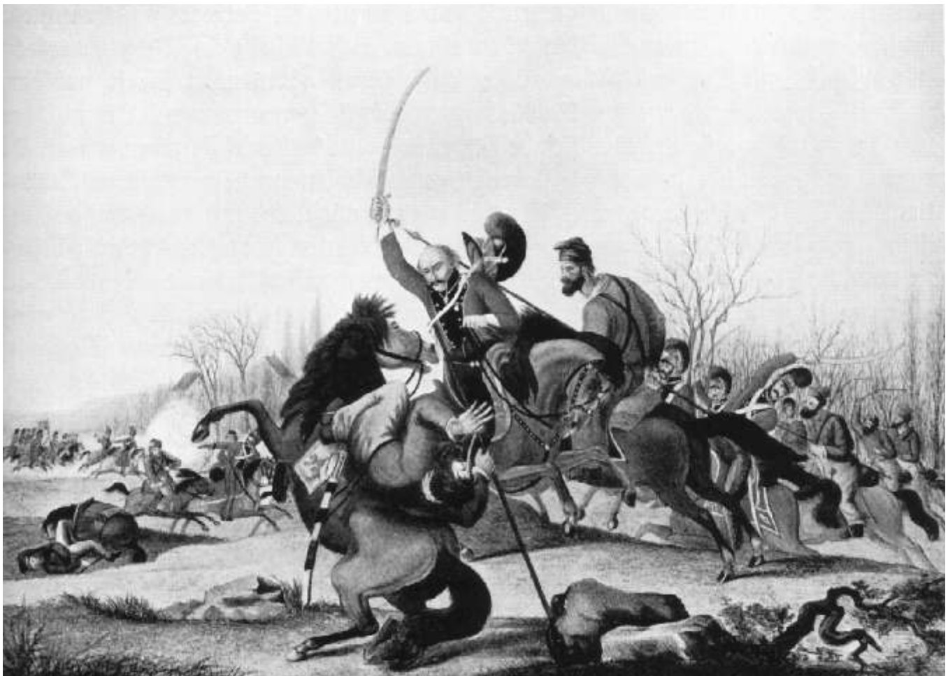
Abb. 4: Schlacht bei Rahlstedt, Königliche Bibliothek Kopenhagen (Künstler unbekannt)

Das Gemälde in Abbildung 4 zeigt einen Ausschnitt des Gefechts bei Rahlstedt am 6. Dezember 1813, irgendwo im Gelände auf der Landstraße zwischen Stapelfeld und Braak. 20 Dargestellt ist das Jütische Regiment leichter Dragoner mit Oberstleutnant von Engelsted im Kampf mit zwei Kosaken. Vielleicht hängen auch