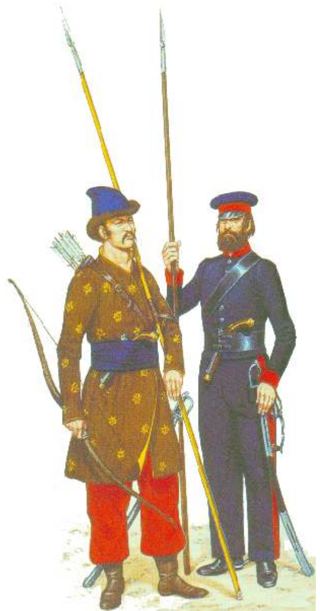
Abb. 3: Baschkir (links) und Don-Kosak (rechts), 1812-1814 15

1811-1813 besetzten die Franzosen Wandsbek und zerstörten vor den vorrückenden Russen alle Brücken über die Wandse. 14