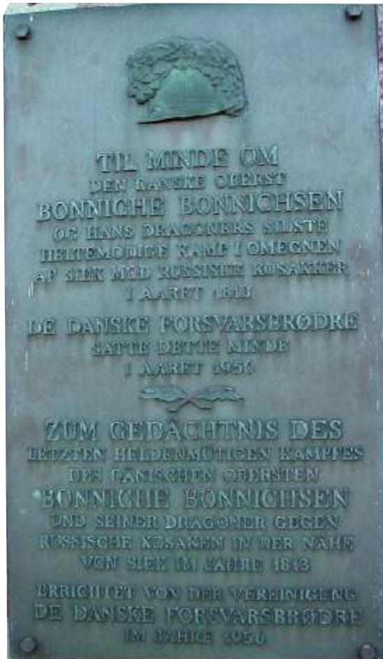
Abb. 5: Dänische Gedenktafel an der Sieker Kirche

die durch Herrn Möring in den 1930er Jahren beobachteten Pferdeskelette am Geidelberg mit diesen Kämpfen zusammen. Den gefallenen dänischen Oberst Bonnichsen begruben preußische Truppen mit militärischen Ehren auf dem Friedhof in Siek. Die Reste des dänischen Dragonerregiments fielen erst auf Rahlstedt und dann auf Wandsbek zurück. In diesem Zusammenhang wurde das Pastorat in Alt-Rahlstedt geplündert, das Archiv wertvoller Akten beraubt und mehrere Personen von den Franzosen erschossen oder erstochen. 21